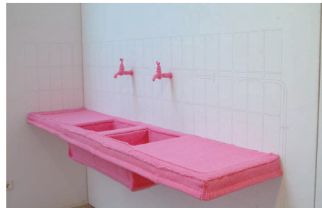
'Gebreide keuken' (2007), aanrecht, ware grootte.

Tekst: Marjolijn van Duyn