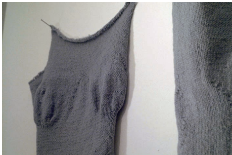
'Zelfportret', gebreide detail, lijf.